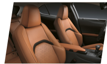
Caramelo (Dual tone)