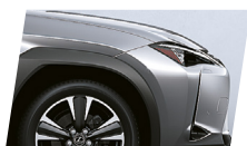
Prata Platium (1J4)