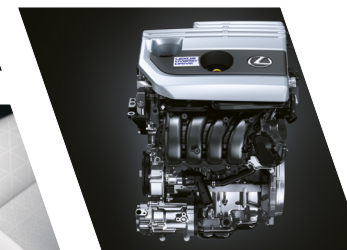
Motor 2.0 L