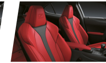
Granada F-SPORT (Dual tone)