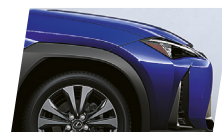
Azul Olímpio (8X1)