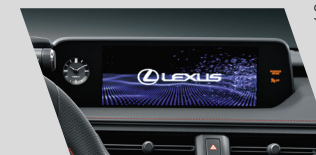
Sistema multimídia Lexus com tela de LCD 3 de 10,3". Acesso às funções da câmera de ré (com guide monitor), DVD player (a) , sistema de navegação GPS (b) e Bluetooth (c) por meio do controle Remote Touch (versões F-SPORT e Luxury)

Ar-condicionado dual zone com sensor de umidade e sistema S-Flow (direcionamento automático do fluxo de ar para os bancos dianteiros com ocupantes) e bancos com sistema de refrigeração (versão Luxury) e aquecimento