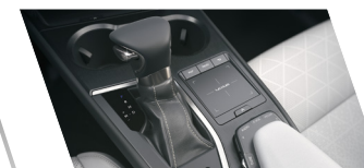
Transmissão Hybrid Transaxle