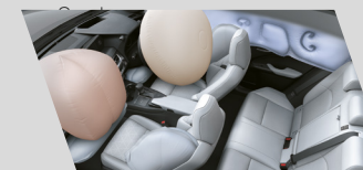
Sistema de proteção com

A linha UX possui itens de segurança desenvolvidos com a mais alta tecnologia, como oito air bags, Controle Eletrônico de Tração (TRC 4 ), Controle de Estabilidade Veicular (VSC 5 ), sensor de chuva e faróis de neblina. Além da câmera de ré, estão presentes sensores de estacionamento traseiros e dianteiros. Para que você tenha ainda mais tranquilidade, o Lexus UX está também equipado com indicador de pressão dos pneus, Assistente Ativo em Curvas (ACA) e Assistente ao Arranque em Subida (HAS).