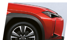
Vermelho Rubio (3T2)