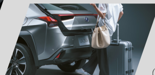
Comando elétrico interno para abertura e fechamento do porta-malas e sistema hands-free (F-SPORT e Luxury)