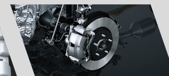
Sistema de freio a disco nas quatro rodas com ABS 6 , EBD 7 e BAS 8