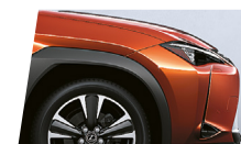
Laranja Terra (4Y1)