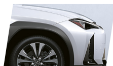
Branco Super Nova (083)