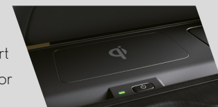
Wireless Charger - carregador de celular sem fio (versões Luxury e F-SPORT)

*Disponível para as versões Luxury e F-SPORT. (a) Por questões de segurança, as imagens da TV digital e do DVD player não serão exibidas enquanto o veículo estiver em movimento. (b) O funcionamento do GPS depende da disponibilidade de sinal da região, bem como de outros fatores, como visão desobstruída do céu. A recepção do sinal, por sua vez, pode ser interrompida facilmente por películas protetoras nos vidros, telefones móveis ou dispositivos eletrônicos, rastreadores próximos ao GPS, existência de árvores, edifícios ou fiação elétrica. Nem todos os municípios do território nacional estão presentes na área de cobertura do mapa. Micro SD Card: Para sua segurança, não manuseie o cartão de memória SD Card quando estiver dirigindo. Quando o cartão de memória SD Card não estiver inserido, nenhum mapa será exibido no sistema multimídia. Recomenda-se que, ao deixar o veículo, o condutor mantenha o SD Card em local não visível a fim de evitar que seja roubado. No caso de perda, roubo ou dano (que impossibilite o uso), outro cartão de memória SD Card poderá ser adquirido na Rede Autorizada Lexus. 2 GPS: Global Positioning System (Sistema de Posicionamento Global). 3 LCD: Liquid-crystal Display (Tela de Cristal Líquido).