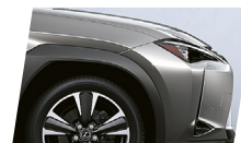
Cinza Titânio (1J7)