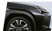
Preto Grafite (223)