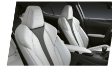
Branco F-SPORT (Dual tone)